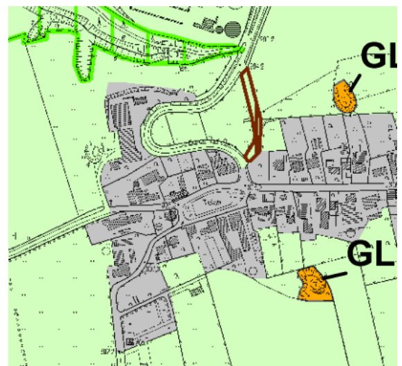
Auszug aus der Festsetzungskarte zum Landschaftsplan Nr. 6

Nach dem Landschaftsplan Nr. 6 Marienmünster liegt die vorhandene Betriebsfläche, mit Ausnahme einer im Westen befindlichen Lagerfläche, außerhalb des Geltungsbereichs des Landschaftsplans und wird dem im Zusammenhang bebauten Ortsteil gem. § 34 BauGB zugeordnet. Die geplanten Erweiterungsflächen liegen im Landschaftsschutzgebiet.