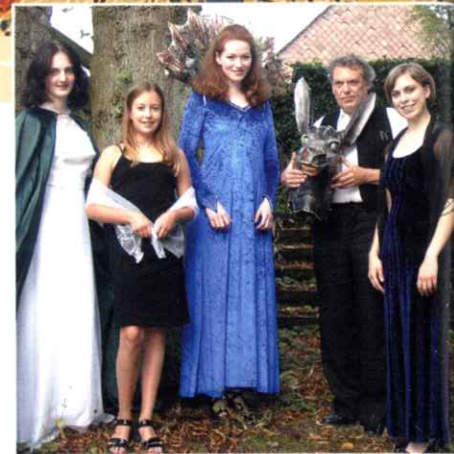
Theateraufführungen in der Schlossscheune

Das Schloss Vörden wurde 1730 an der Stelle einer ehemaligen Burg errichtet und bietet ein traumhaftes Ambiente für Events.