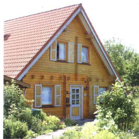
Eines der Ferienhäuser, hier als Bioholzhaus