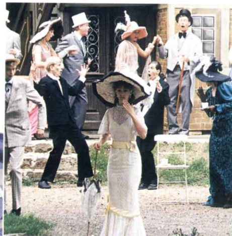
Theatersommer - Freilichtbühne Böckendorf

Bahnanschlüsse gibt es in den naheliegenden Nachbarstädten Steinheim, Brakel und Höxter. Von dort geht es bequem weiter mit bereitstehenden Bussen oder Sie lassen sich ganz einfach von Ihrem Gastgeber vom Bahnhof abholen.